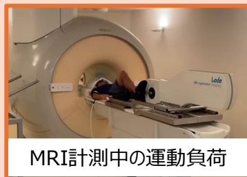
MRI計測中の運動負荷

主な測定項目：体組成（身長、体重、体脂肪など）、血圧・心拍数、 脳・心・腎血流、脳の形態と機能、呼吸機能、VO 2 max