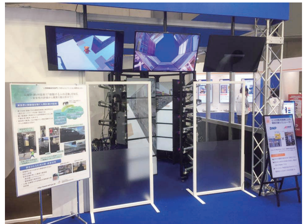
図3 サービスフィールドシミュレータを展示会に出展した際の様子

図3はSFSをDNP社が出展した展示会で活用いただいた時の写真になります。これは、SFSをマーケティングツールとして活用した事例の出展という位置づけですが、図1の物流倉庫（フレームワークス社、ユアサ商事