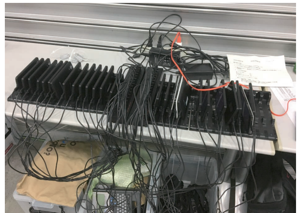
図1 スマートフォンがたくさんあります(サービス現場での行動計測用)

例えば、図1は実際の物流現場にスマートフォンやBLEタグを持ち込んで、作業者の行動計測した際の写真になります。スマートフォン(センサモジュール)で得られる加速度、角速度、磁気、気圧の各センサ情報を用いたPDR(歩行者自律航法)の結果とBLE測位、マッ