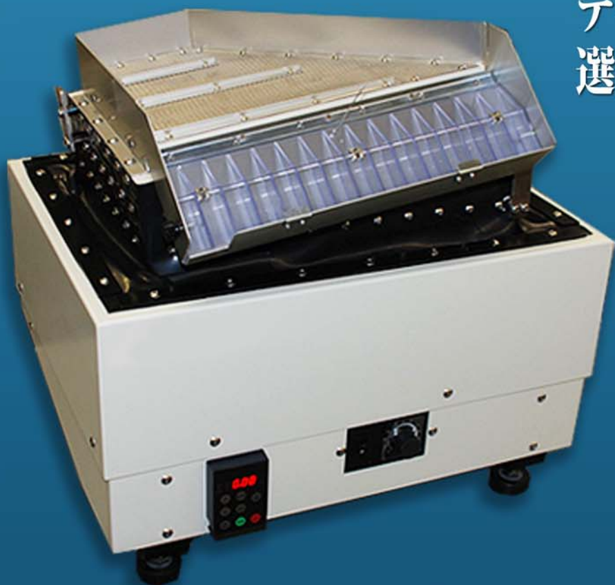
精密選別試験仕様（新提案）