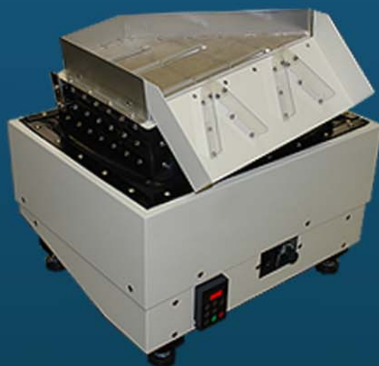
連続回収仕様（従来型）