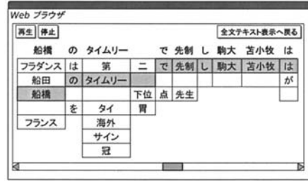
図2: 「音声訂正」 14) に基づく音声認識誤り訂正用インタフェース（通常の認識結果の下に競合候補が提示される）

ユーザが、検索したポッドキャストを「聞く」だけでなく、テキストで「読む」ことができる機能であ